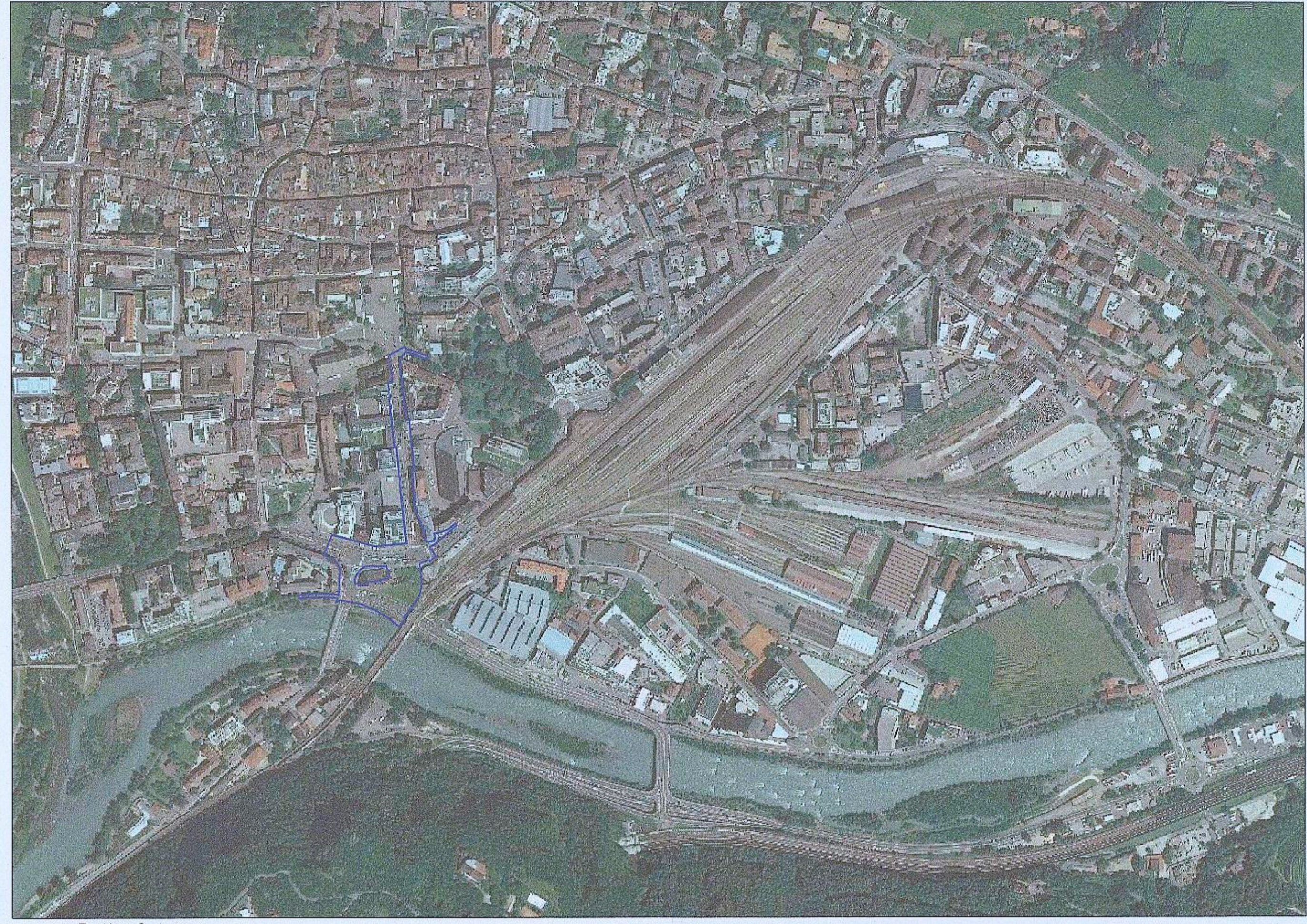
Orthofoto Ortofoto 1 : 5.000